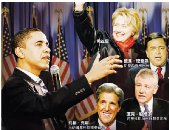
奥巴马国务卿的候选人名单

林肯争取1860年总统选举共和党候选人提名时,前纽约州联邦参议员威廉·亨利·苏厄德是他的最大对手。由于对林肯的蔑视,苏厄德1859年有8个月在欧洲度过。林肯赢得总统选举后尽弃前嫌,邀请苏厄德出任国务卿。