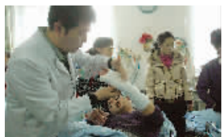
■医生正在给受伤者打石膏