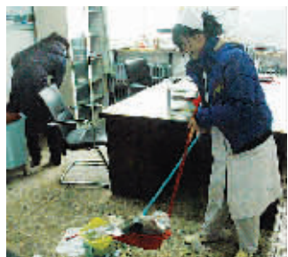
■工作人员正在清理接诊室